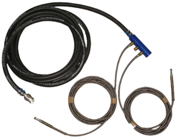
Mangueiras, Conexões e manifold