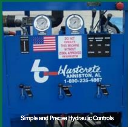
Simple and Precise Hydraulic Controls