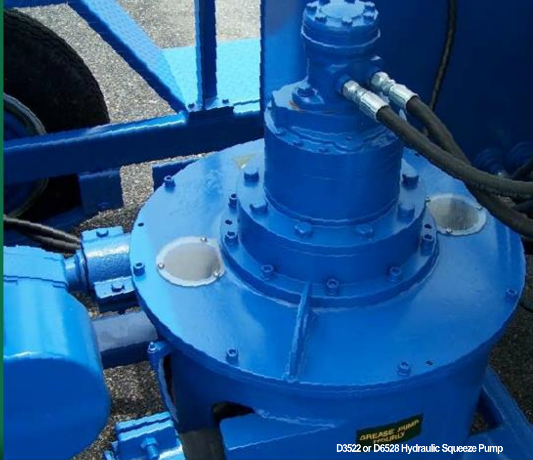
D3522 or D6528 Hydraulic Squeeze Pump