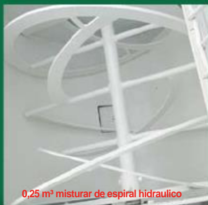
0,25 m 3 misturar de espiral hidraulico